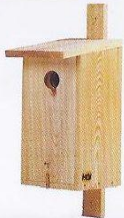
Typ B PREMIUM (szpak, krętogłów, dudek)